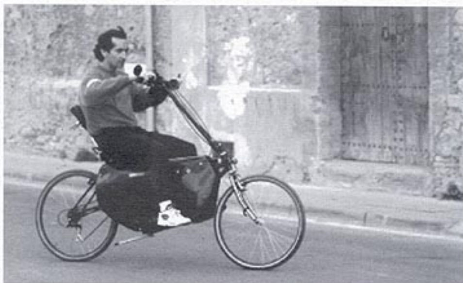
La missatgeria del futur